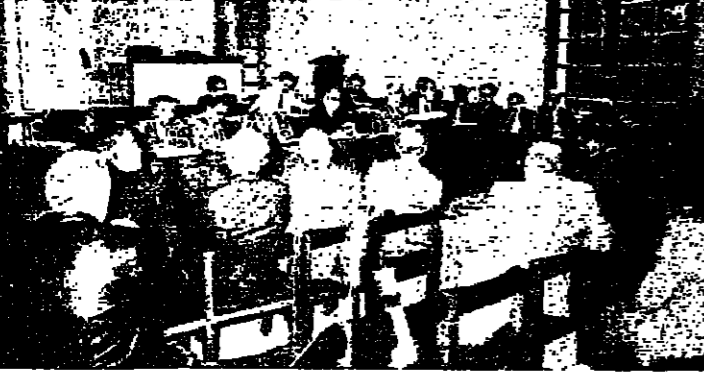
اللجنة النيابية للعمل والموازنة في قصر منصور